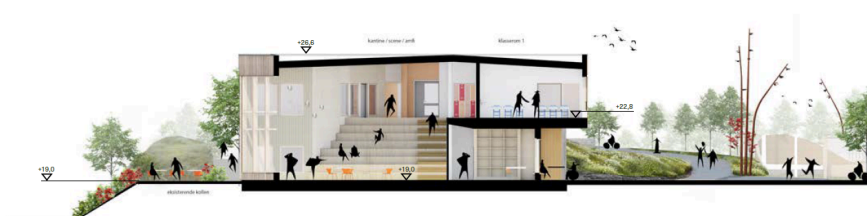
Snitt A 1:200