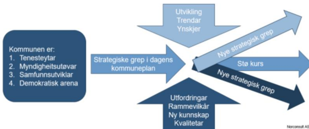
Figur henta frå Solund kommune sin samfunnsdel 2020 – 2030.

Formålet med planarbeidet er å revidere den gjeldande samfunnsdelen frå 2020, slik at den er i tråd med gjeldande føringar, nasjonale og lokale utfordringar, og ynskja utvikling. Det er planlagt å behalde struktur og gjere justeringar i gjeldande samfunnsdeldokument. Prosessen i førre revisjon var omfattande og med bakgrunn i dette så vert det tilrådd ei liten revisjon. Ein ser likevel behov for justeringar i samband med det som er kartlagt så langt i prosessen med kommunal planstrategi.